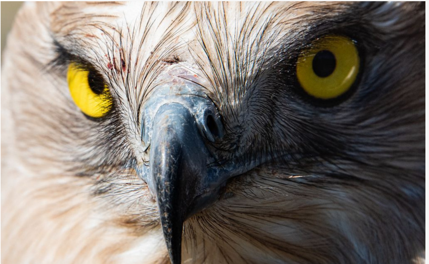
Laché d'un circaète jean-le-blanc par Michel Phisel, gros plan