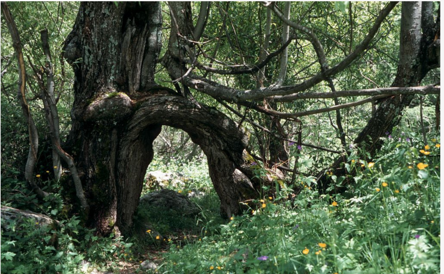
Arbre remarquable dans le vallon du Tourond - Marc Corail - Parc national des Ecrins