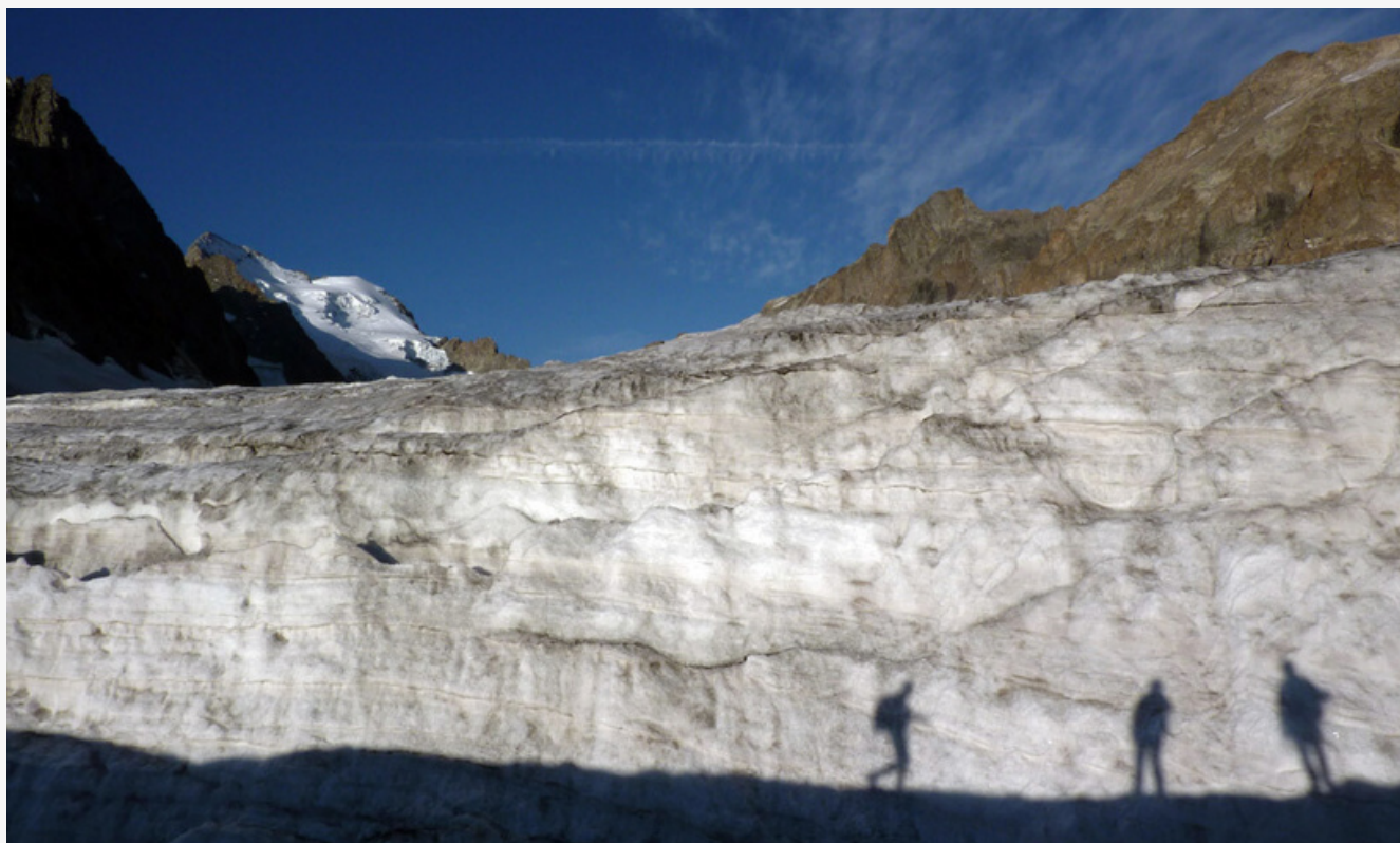
Glacier blanc, la barre et le dome des Ecrins en arrière plan